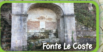
Fonte Le Coste