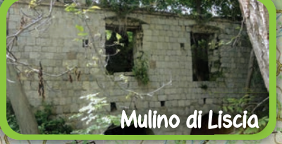
Mulino di Liscia