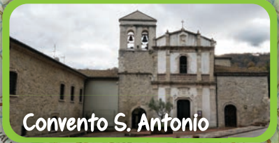
Convento S. Antonio