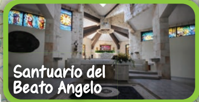
Santuario del Beato Angelo